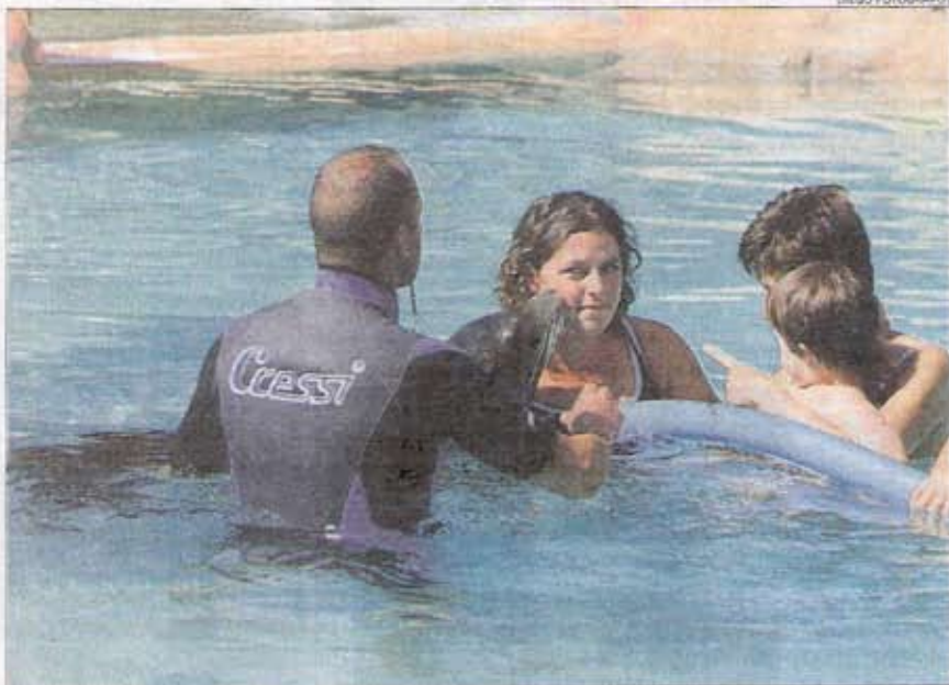
El animal logró despertar las sonrisas y los llantos de los pequeños más asustadizos.

Pero a todas estas atracciones es importante añadir una firme